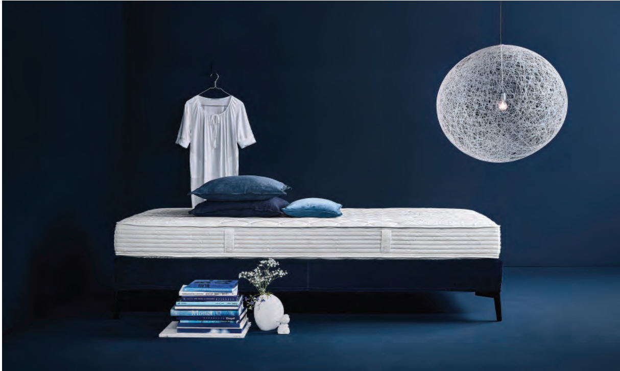
03 Möller Design, Paisley