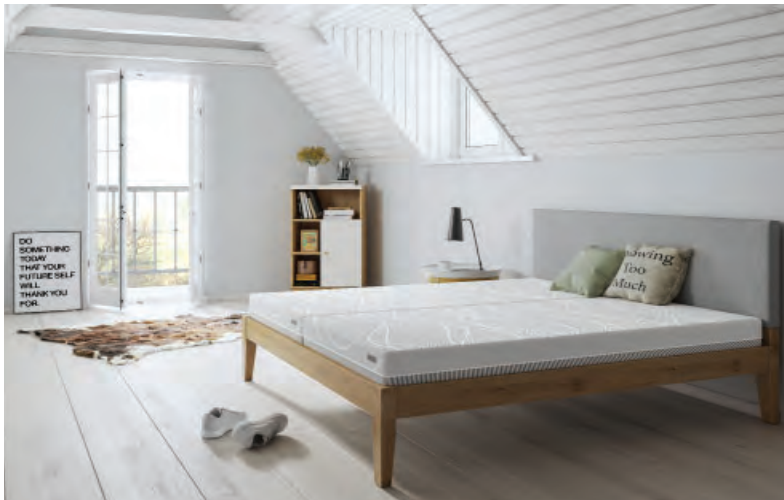
01 Schlaraffia, myNap