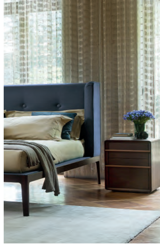
07 Porada, Ziggy Bed