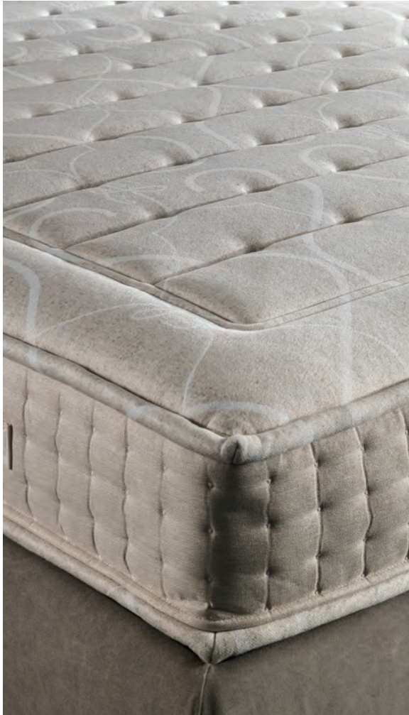
02 Materassificio Montalese , Nature