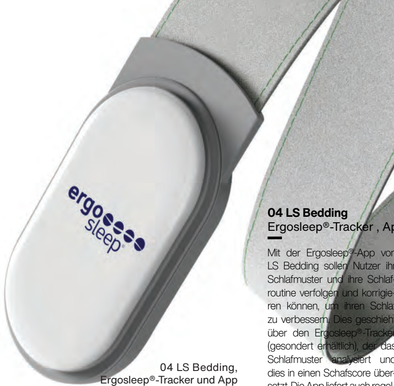
04 LS Bedding, Ergosleep®-Tracker und App

Der Trend zum Klarträumen weist darauf hin, dass Schlaf zunehmend wieder als Erlebnis wahrgenommen wird. Und mit dem wachsenden Bewusstsein um die Bedeutung des Schlafs für unsere Gesundheit und Leistungsfähigkeit wird Schlafen zu einem Lifestyle – einer Haltung, einer Lebensart, bei der guter Schlaf nicht nur als Luxus gilt, sondern als Voraussetzung für eine gute Tages-Performance. Um guten Schlaf zu erreichen, braucht es allerdings mehr, als sich Zeit zu nehmen. Man muss auch etwas dafür tun: Die Schlafumgebung verbessern, positive Rituale einführen, ungünstige Verhaltensgewohnheiten verändern. Und sich gut beim Kauf des Bettes beraten lassen, hochwertige Matratzen wählen, Apps zur Schlafkontrolle und -verbesserung einsetzen und die Tipps von Schlafcoaches beherzigen.