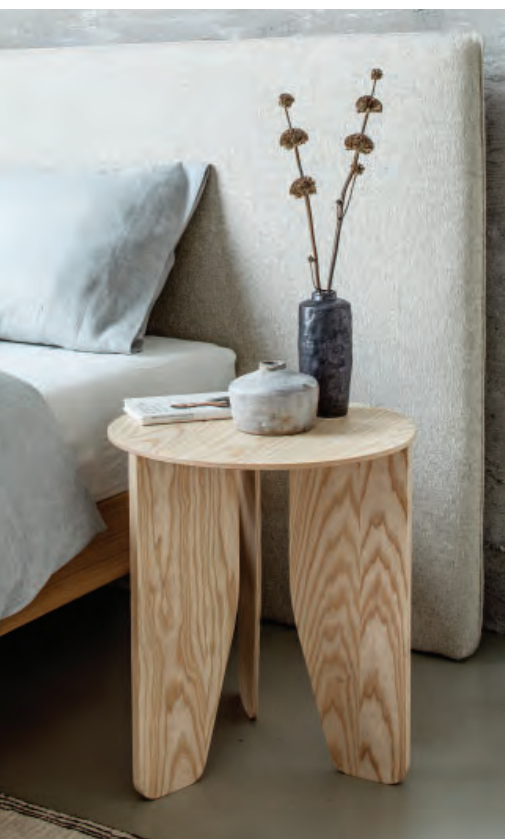
17 [more], CUT