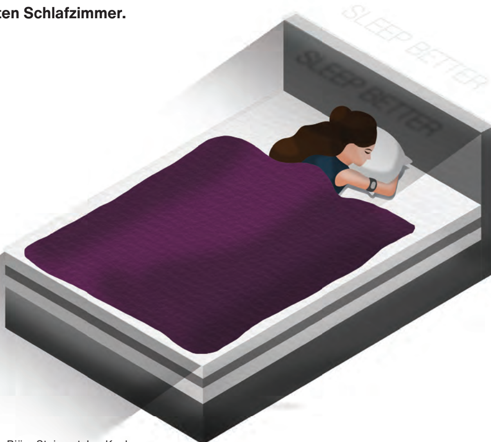
Illustration: Björn Steinmetzler; Koelnmesse

Schlaf ist individuell. So ist es auch mit der idealen Schlafumgebung und dem perfekten Bett. „In keinem Schaufenster, in keiner Abteilung eines Möbelhauses steht das für eine Person perfekte Schlafzimmer oder Bett“, so die Einschätzung der „Schlafonauten“ Fabian Dittrich und Johannes Sartor. Die Schlafcoaches beschreiben zum imm cologne Trendbriefing Sleep eine Reihe von Tipps und Regeln, mit denen sich der Schlaf verbessern lässt. „Mit einer kühlen, dunklen, ruhigen und gut gelüfteten Schlafumgebung tun wir uns und unserem Schlaf schon viel Gutes.“ Mit dieser beruhigenden Einschätzung startet die Suche der Schlafonauten nach dem perfekten Schlafzimmer.