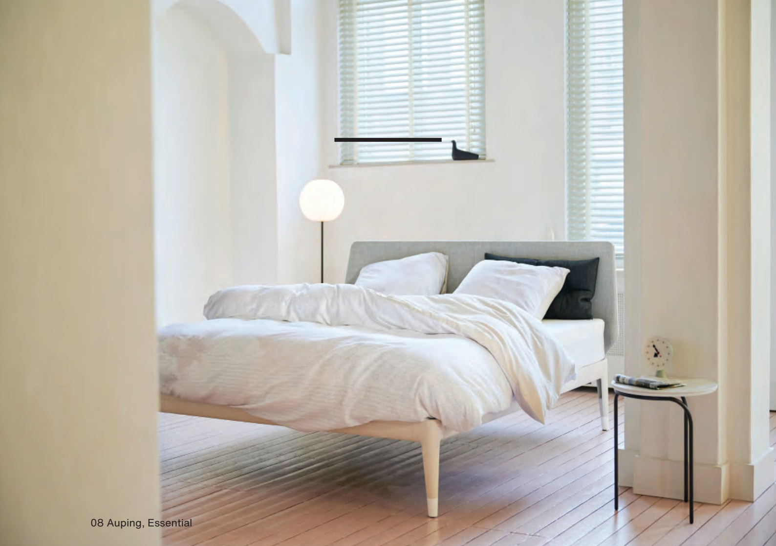
08 Auping, Essential