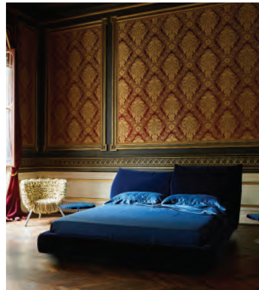
15 Edra, Stand by Me