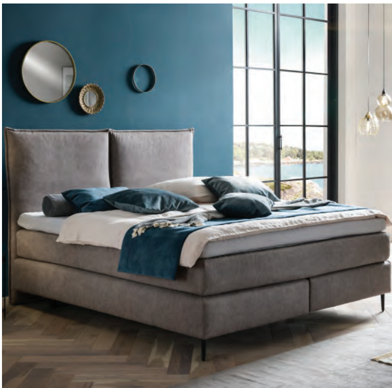
09 Lück, Manhattan

Schlafzimmer von Connect bis Home, von den Textilmarken bis zu den Design-Editoren bewegt und was Kreativ- und Hersteller-szene insgesamt beizutragen haben.“