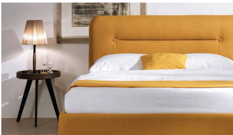
20 Materassificio Montalese, Bridge