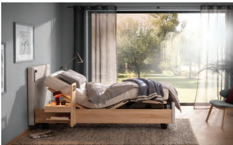
02 Rummel Matratzen, My care bed