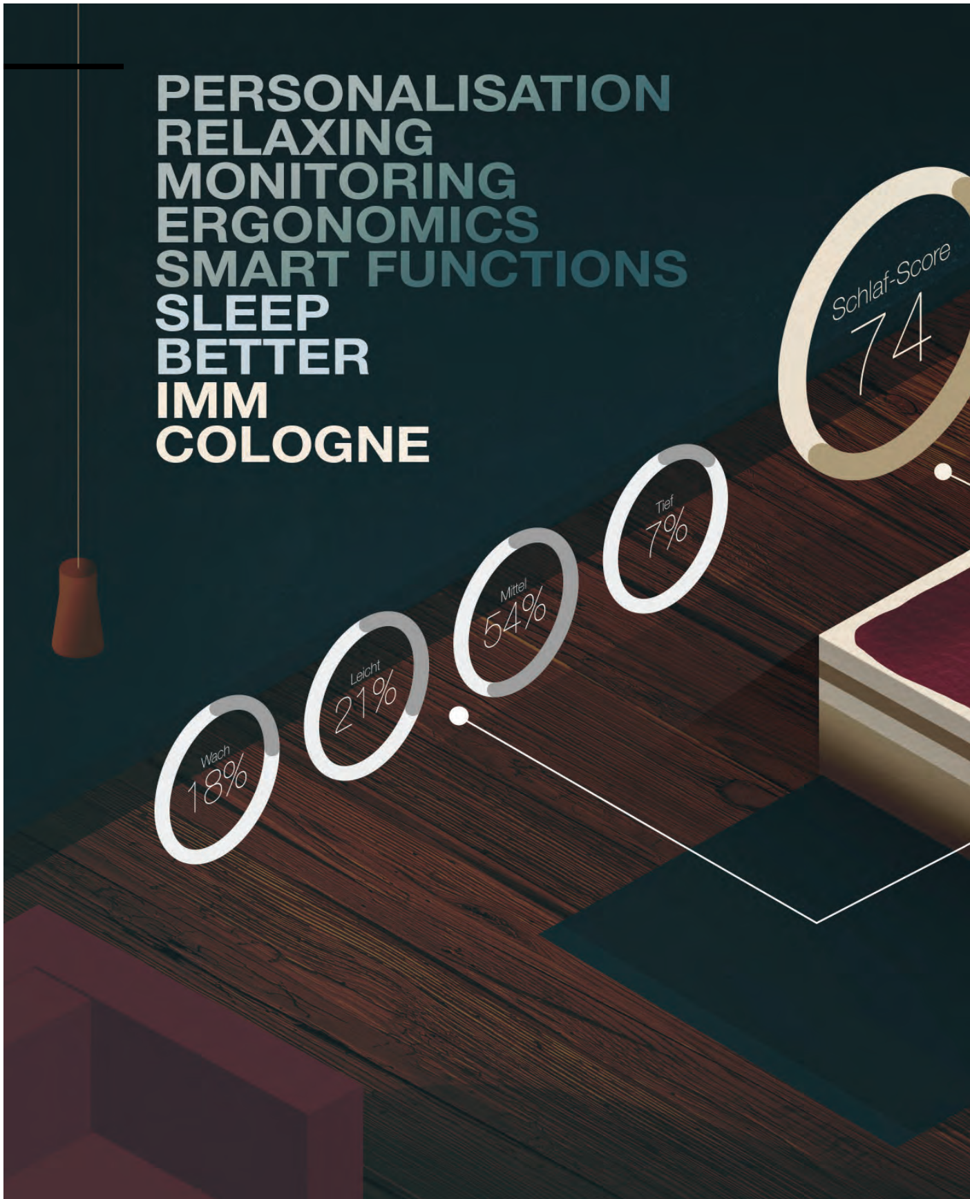
Illustration: Björn Steinmetzler; Koelnmesse