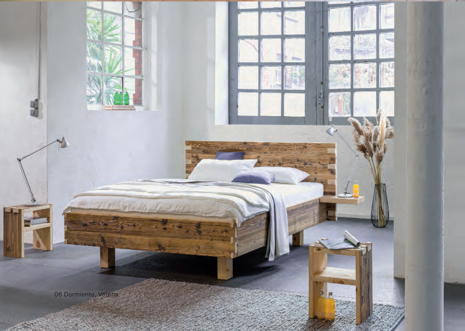
06 Dormiente, Veteris