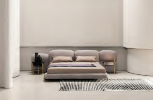
01 Baxter, Stone