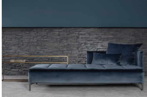
03 Schramm Werkstätten, Remy