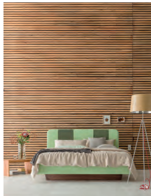
16 Dormiente, Clia