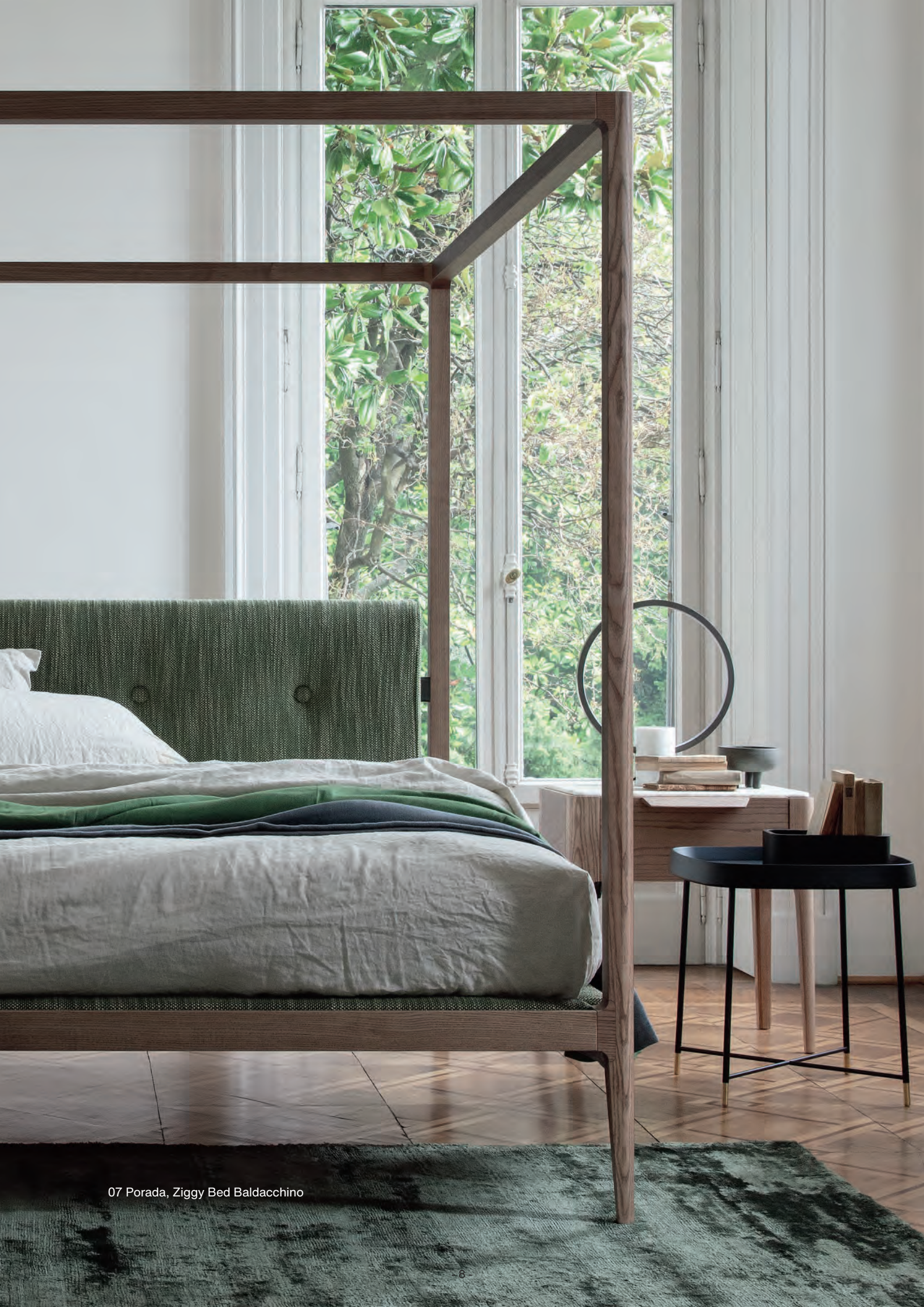
07 Porada, Ziggy Bed Baldacchino