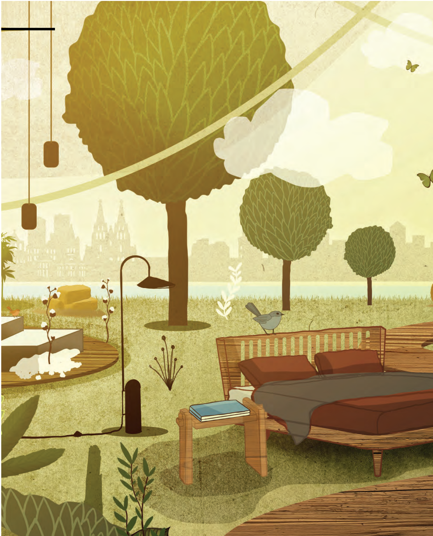
Illustration: Björn Steinmetzler; Koelnmesse