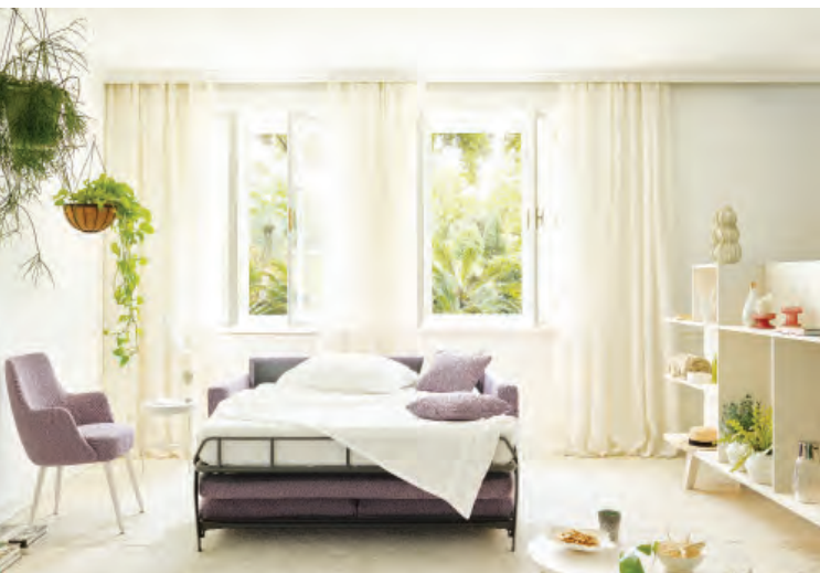
11 Joka, Onda