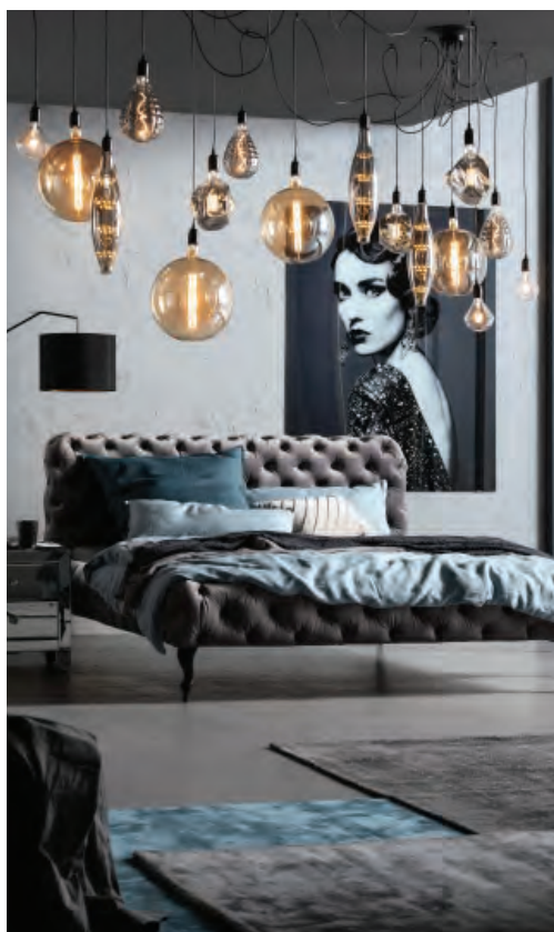
10 Kare Design, Desire