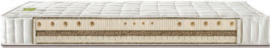
01 Dormiente, Natur Pur Matratzen

erprobt. Die Bettenbranche bewegt sich experimentierfreudig aus ihrer „Komfortzone“. In dieser Situation braucht die Branche mehr denn je eine Austauschplattform, auf der alle Beteiligten die Optionen für einen auch ökonomisch gangbaren „grünen Weg“ diskutieren können. Nachhaltigkeit, so sind sich Vertreter aus Industrie, Handel und der Koelnmesse sicher, wird daher auch das Messegespräch auf der nächsten Kölner Einrichtungsmesse sein.