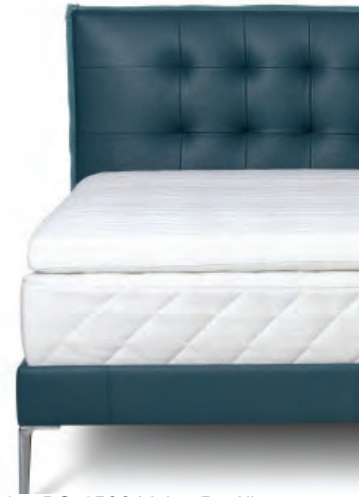
19 de Sede, DS-4500 Living Pacific