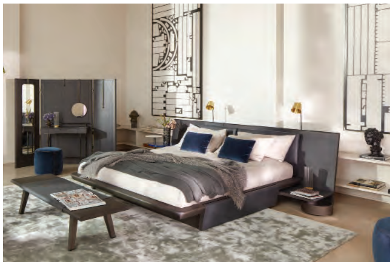
18 Cassina, Acute