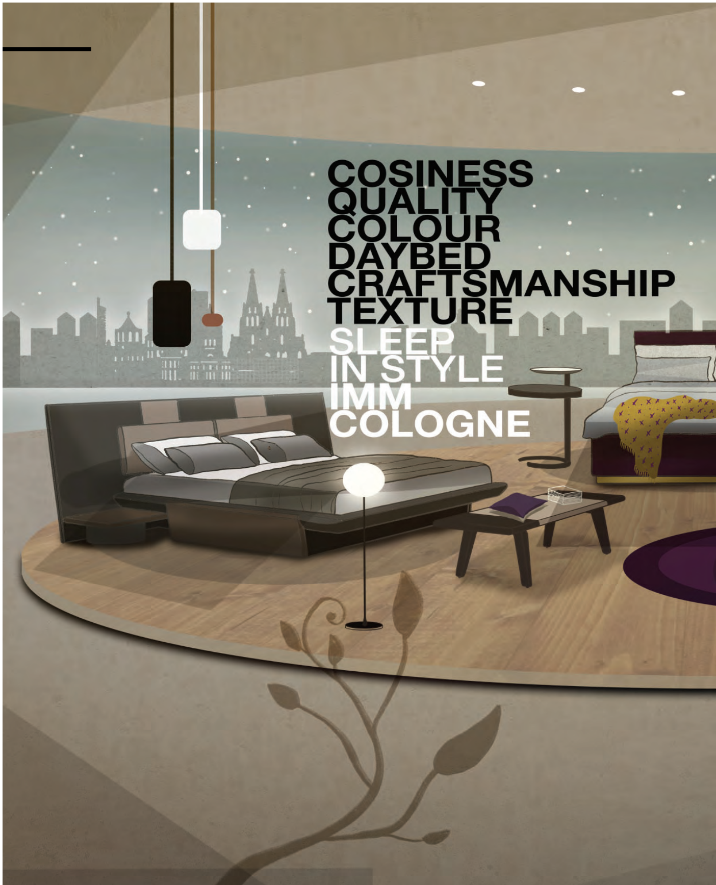
Illustration: Björn Steinmetzler; Koelnmesse