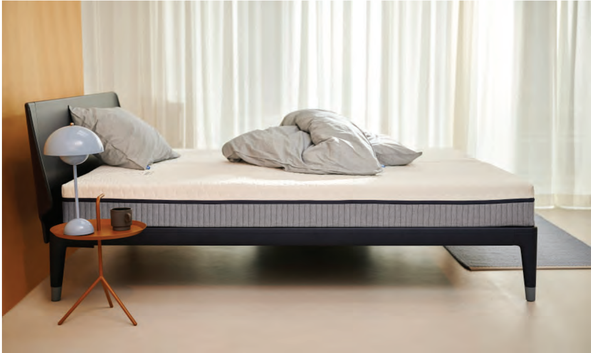
07 Auping, Evolve

mensetzung und einer oftmals nicht ausreichenden Kreislaufqualität der Ausgangsmaterialien (Latex und die üblichen Schaumstoffe können meist nicht ohne Downcycling verarbeitet werden), gelten Matratzen als äußerst schwierig zu recyceln.