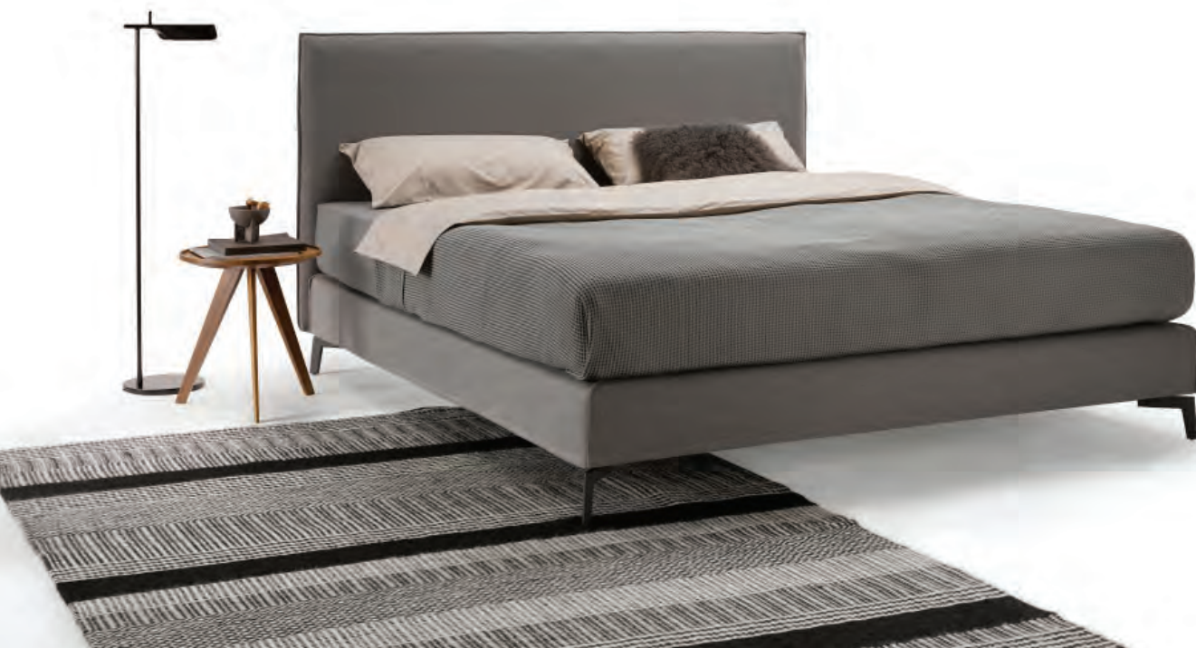
08 Möller Design, Slim Edition 21