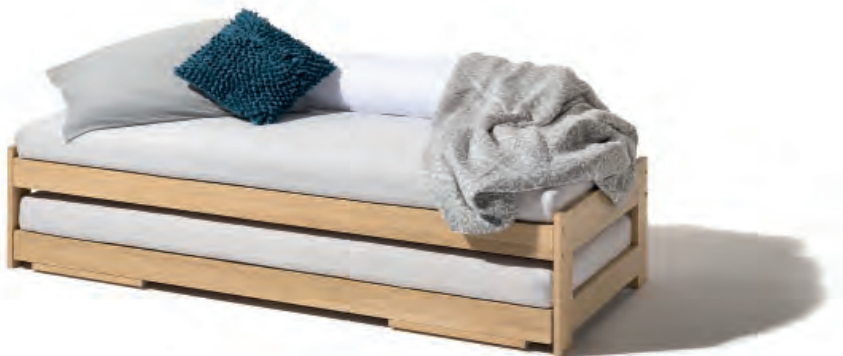
04 Team 7, Cubus