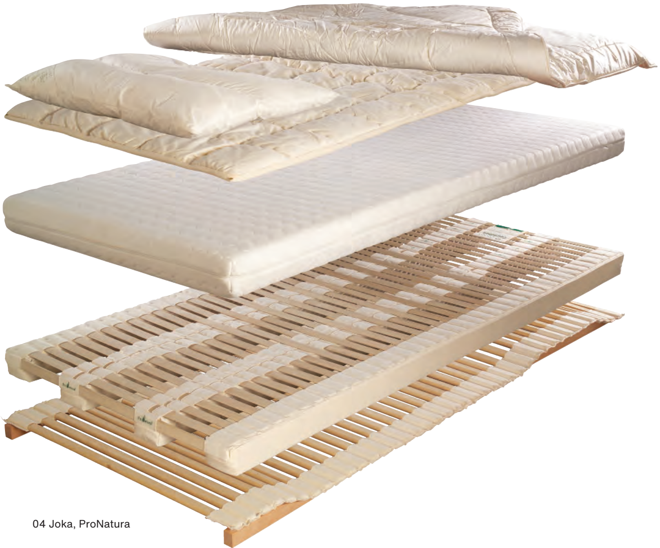
04 Joka, ProNatura