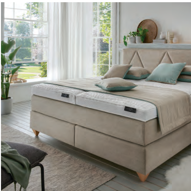
05 Frankenstolz, Pyramedus

Matratzen und, unter Einbezug des persönlichen Stils, in ganze Schlafsysteme münden. Ebenso im Kommen: Intelligente und verstellbare Betten, mit denen die Nutzer unter Einbindung einer App ein gesundes Schlafprofil entwickeln können. Ein solches System kombiniert eine vielfältig verstellbare Basis mit einer App zu einem integrierten Schlafsystem. Eine solche Anwendung bedient sich biometrischer Sensoren und bietet eine berührungslose, intelligente Schlafqualitätsüberwachung.