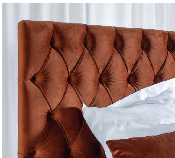
21 Schramm Werkstätten, Claire