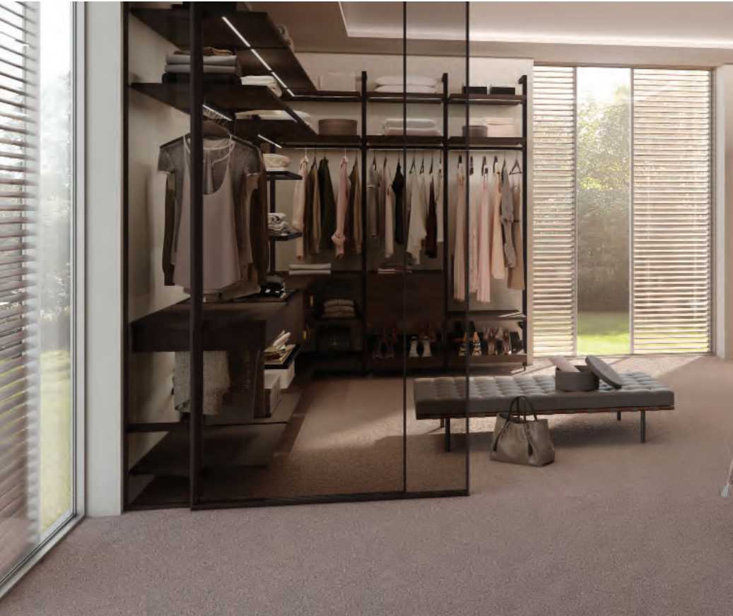
06 Raumplus, Legno Uno System S1200 Air