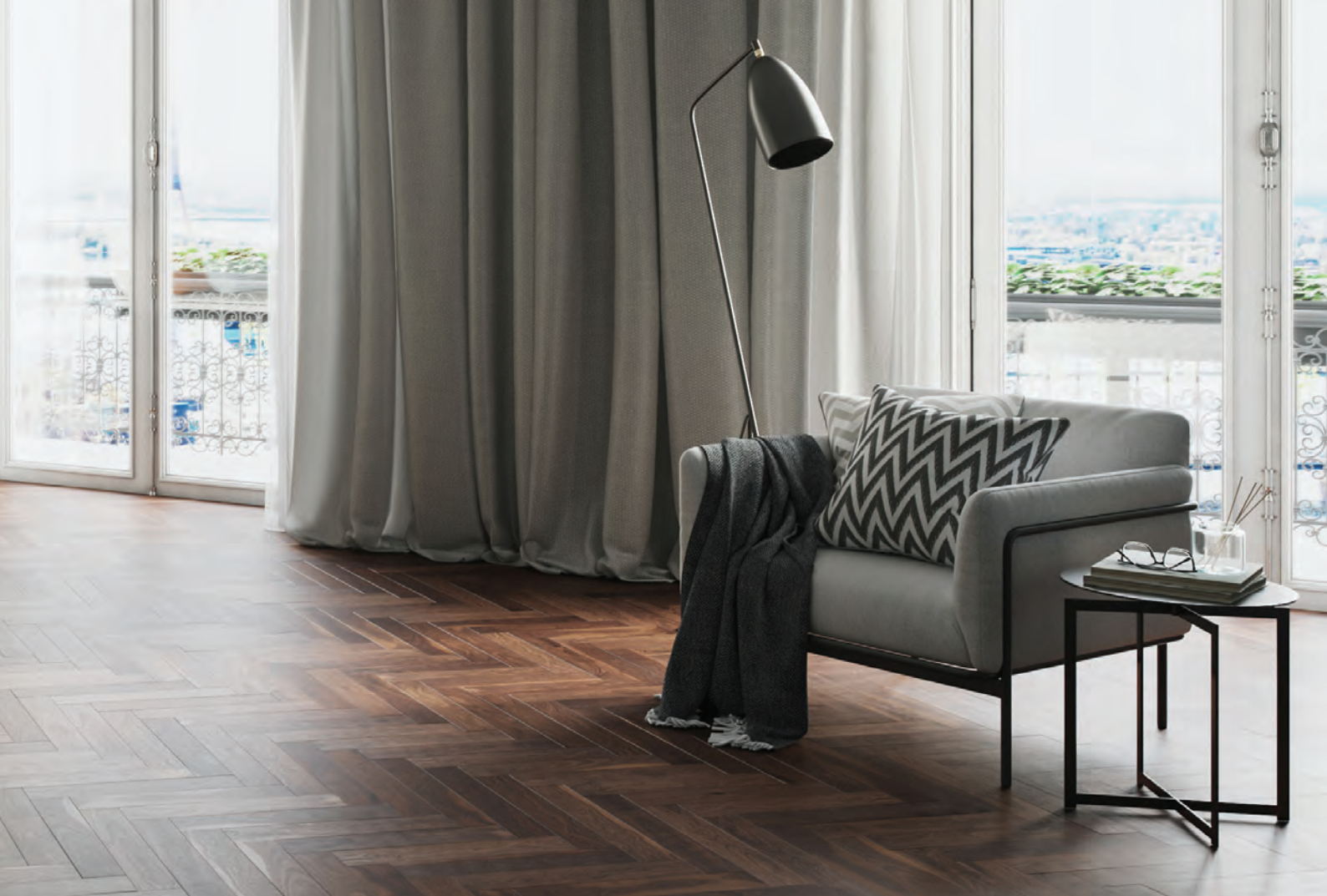
14 Emma, Emma Boxspringbett