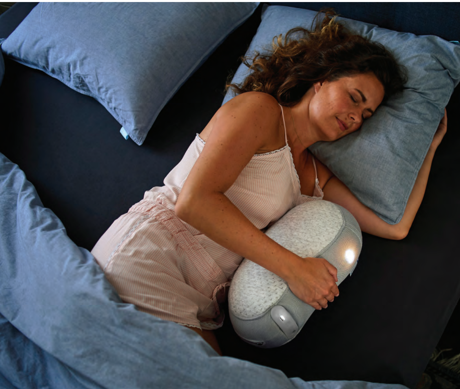
06 Aping Royal, Somnox