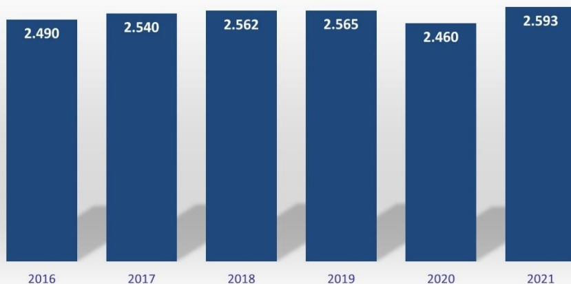
Ausgaben für Baby- und Kinderausstattung in Deutschland in den ersten 3 Lebensjahren in Mrd. Euro

Laut vorläufigen Angaben des Statistischen Bundesamtes erblickten im letzten Jahr 795.492 Kinder das Licht der Welt. Rund 22.000 mehr als 2020 . Kündigt sich hier die Generation Coronaboomer an? Dass besonders viele Kinder im vierten Quartal 2021 zur Welt kamen, lässt auf einen Zusammenhang mit dem zweiten Corona-Lockdown im Winter 2020/21 schließen. Auch die Geburtenziffer je Frau ist 2021 erstmals seit 2017 wieder gestiegen, und zwar von 1,53 Kindern im Jahr 2020 auf 1,58 Kinder je Frau im Jahr 2021.